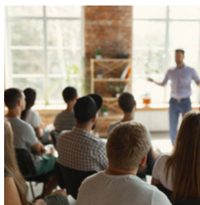
2 LES CONFÉRENCES - P.5