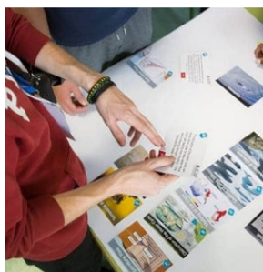
1 LES FRESQUES - P.4