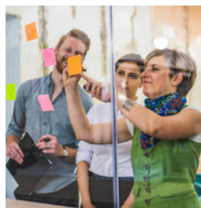
3 LES PETITS FORMATS - P.6